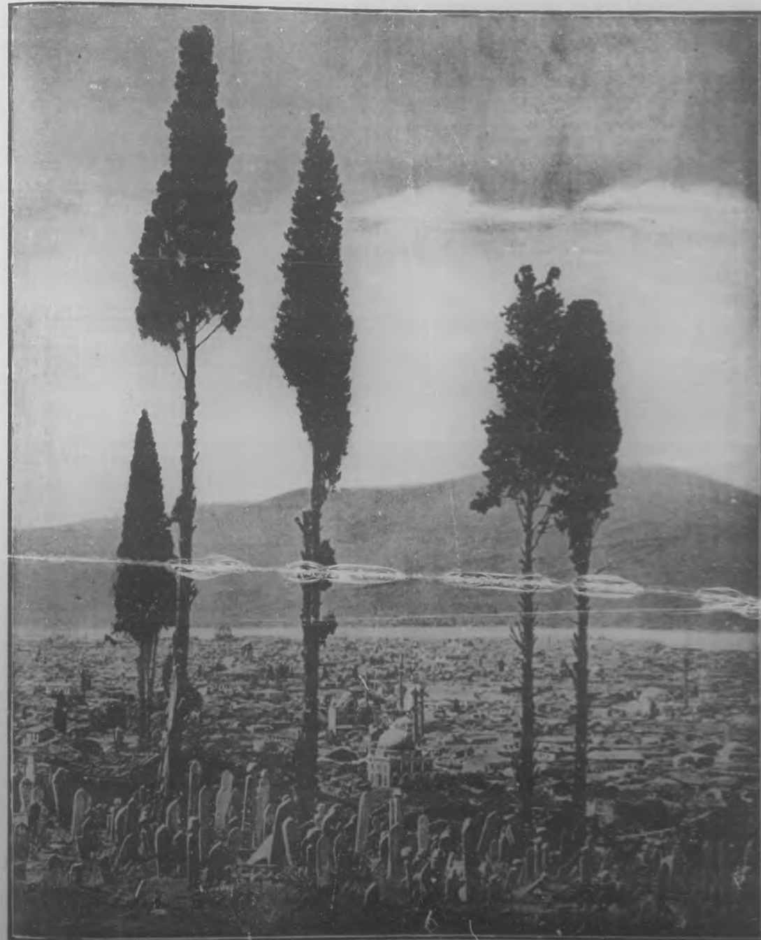
Hermosa perspectiva de Smyrna, la bella y antigua ciudad griega del Asia Menor, que últimamente atrajo la atención universal con motivo de haber sido incendiada por los turcos.

Redacción, Administración y Talleres: BOHEMIA , Trucadero número 50, 51 y 53 - Teléfono: Dirección 1122; Administración, 1123.