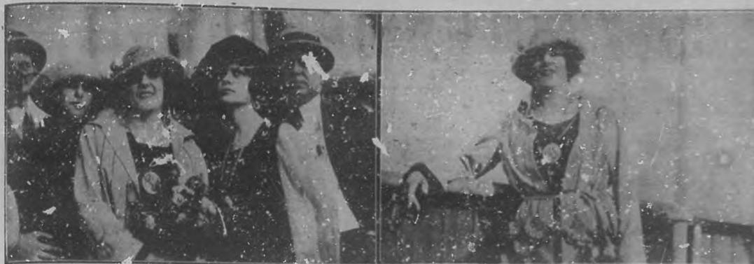
La genial actriz argentina Camila Quiroga en la bo. da del buque que la trajo a la Habana.