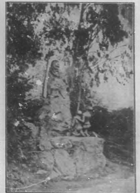
Monumento a Cervantes en el "Golden Gate Park", San Francisco de California, regalado a la ciudad por el filántropo español.