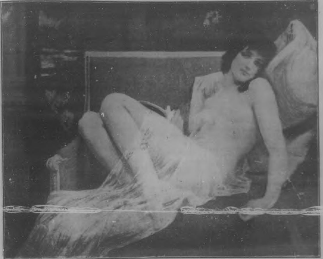
INDOLENCIA Cuadro de G. Seignac.