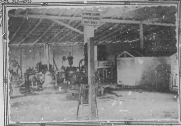
Planta de envase.

su agradable sabor resulta más recomendable es la que procede de la fuente del Obispo en Gaanabacoa, conocida hoy generalmente con el nombre de Agua del Hogar.